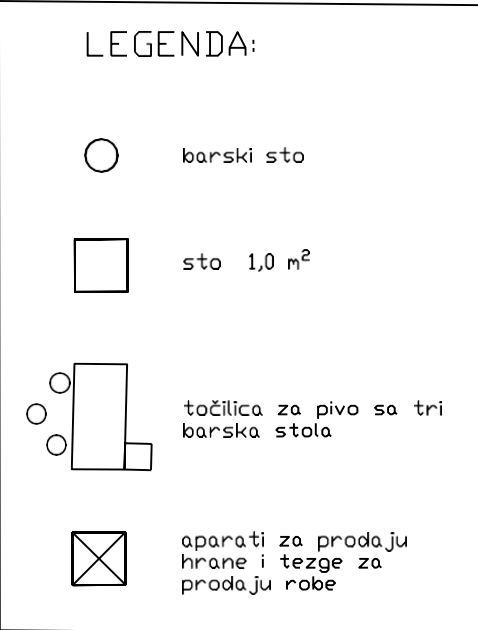
Skica br. 1